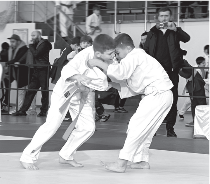
Жаркие схватки на татами

В минувшее воскресенье, 21 декабря, в Черкесске, в спорткомплексе «Юбилейный», прошёл 4-й, финальный, этап Кубка СКГА по дзюдо. В турнире принимали участие более 400 юных дзюдоистов 2013–2014 и 2015–2016 годов рождения из Кабардино-Балкарии, Ингушетии, Чеченской Республики, Ставропольского и Краснодарского краёв и Карачаево-Черкесии.