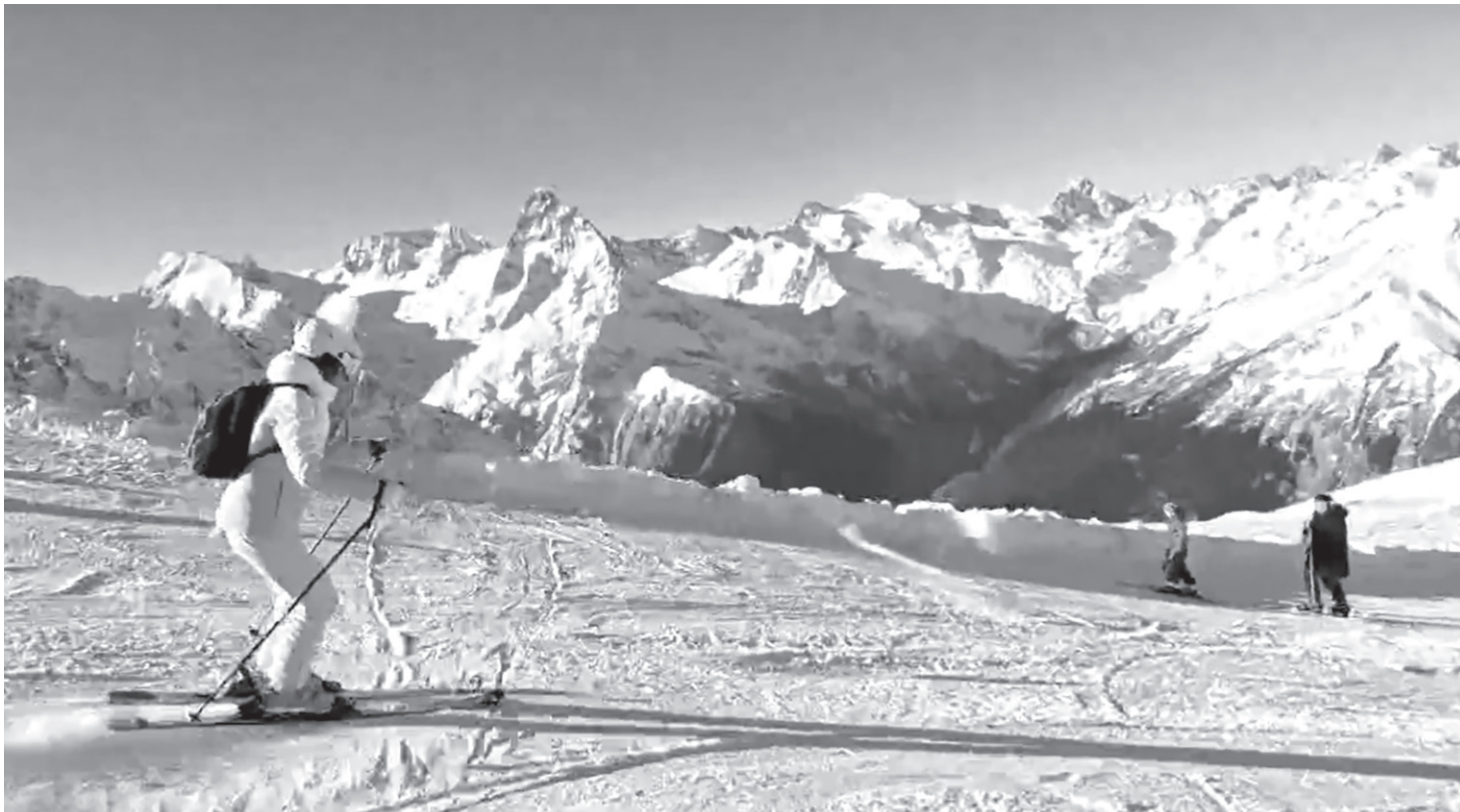
От панорамы, открывающейся с горы Мусса-Ачитара, захватывает дух

Массовый спуск 1500 горнолыжников и сноубордистов из разных уголков России с горы Мусса-Ачитара состоялся 20 декабря в честь начала зимнего сезона в Домбае. Организаторами феерического праздника, проходившего на двух площадках, стали ООО «Канатные дороги Домбая», Тебердинский национальный парк, администрация Карачаевского городского округа.